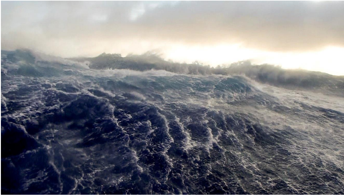
冬季月份搜索 MH370 时，辉固发现号在南印度洋面临汹涌的波涛。