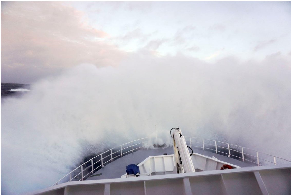
冬季月份搜索 MH370 时，辉固发现号在南印度洋面临汹涌的波涛。

未来数日，预计天气将进一步恶化，周末尤其如此。冬季期间，搜索行动将继续进行，但预期会有停顿。